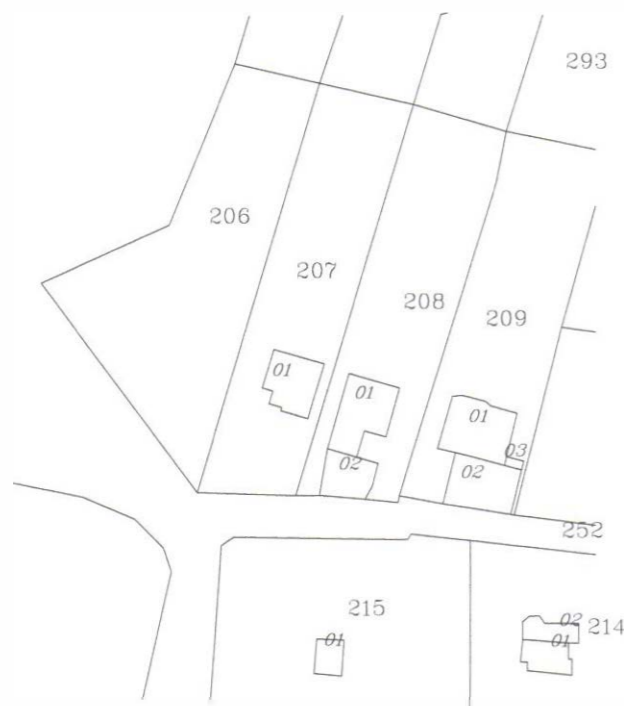
ИЗВАДКА ОТ КАДАСТРАЛНА КАРТА