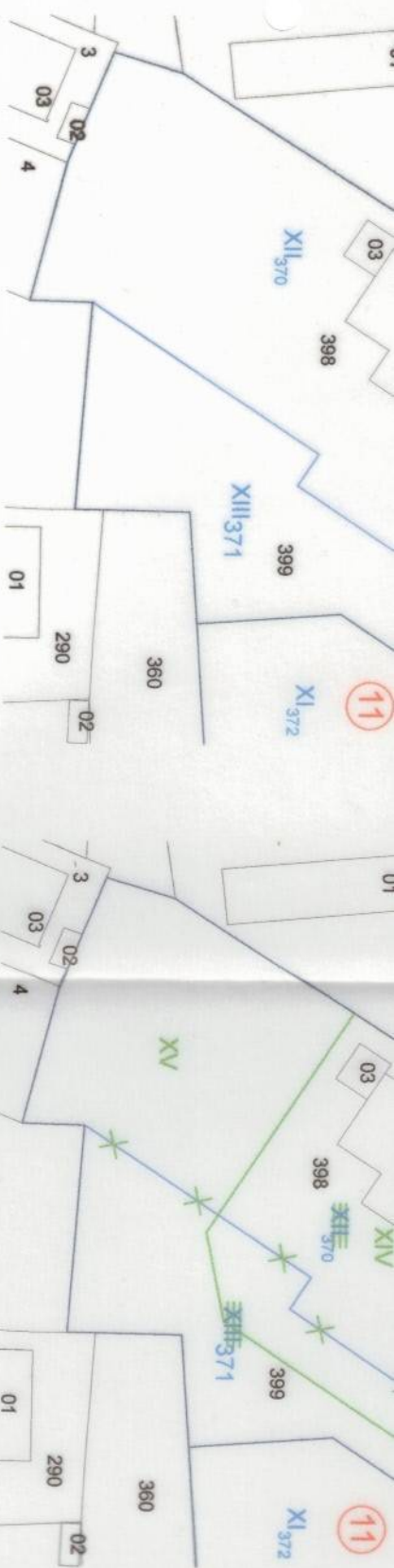
ИЗВАДКА ОТ ДЕЙСТВАЩ ПУП - ПУР