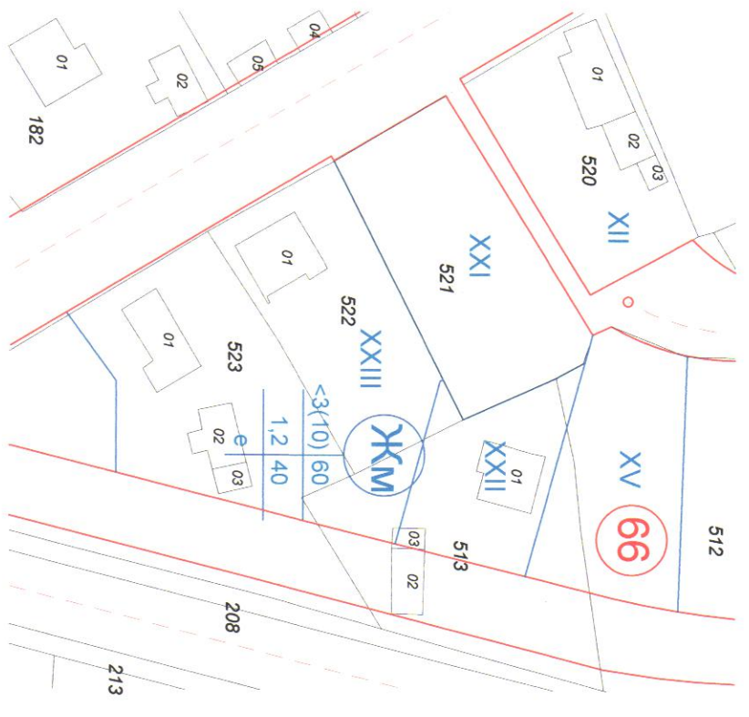
ПУП - ПЛАН ЗА РЕГУЛАЦИЯ