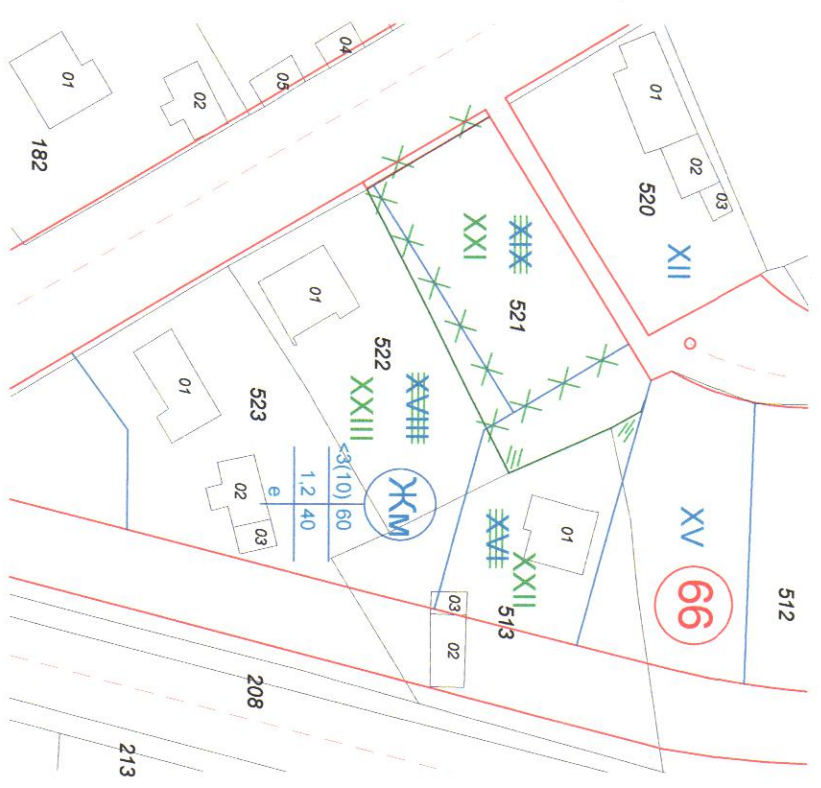
ИЗМЕНЕНИЕ НА ПУП - ПР