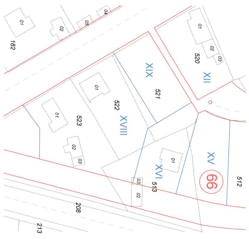
ИЗВАДКА ОТ ДЕЙСТВАЩ ПУП - ПР