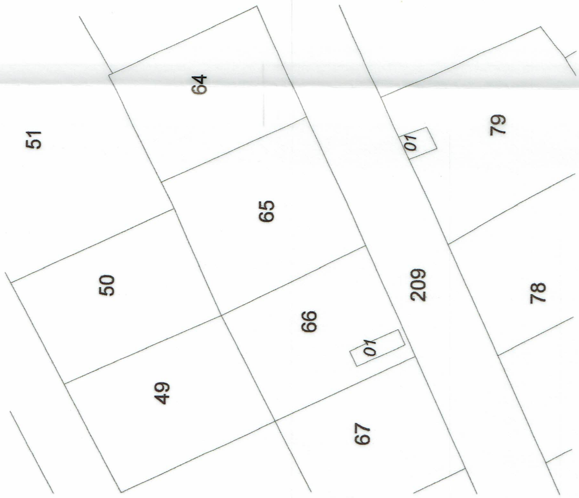
ИЗВАДКА ОТ КАДАСТРАЛНА КАРТА