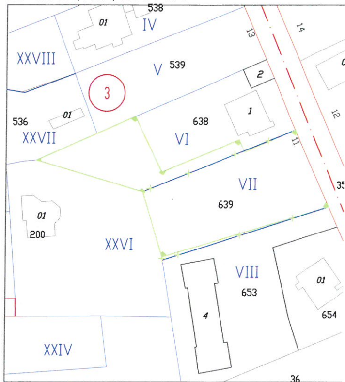
СКИЦА - ПРЕДЛОЖЕНИЕ ЗА ИЗМЕНЕНИЕ НА ПУП - Г ПО ЧЛ. 134, АЛ.2, Т.2 ОТ ЗУТ