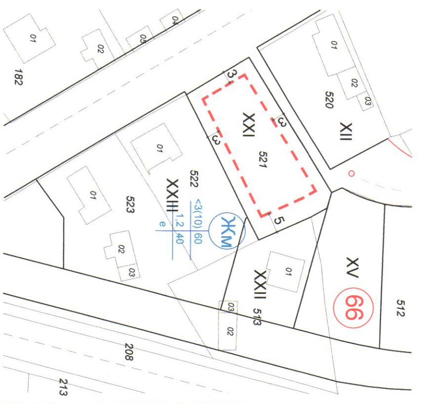
ПУП - ПЛАН ЗА ЗАСТРОЯВАНЕ