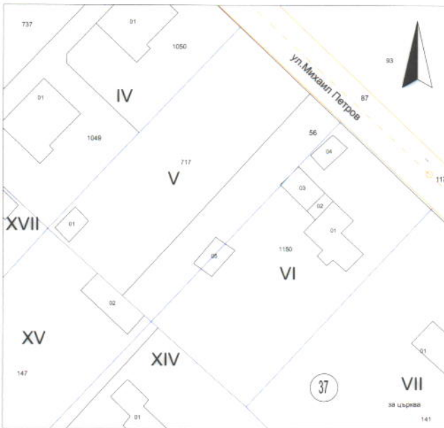
ИЗВАДКА ОТ ДЕЙСТВАЩИЯ РЕГУЛАЦИОНЕН ПЛАН ВЪРХУ ОДОБРЕНА КАДАСТРАЛНА КАРТА, М 1:1000