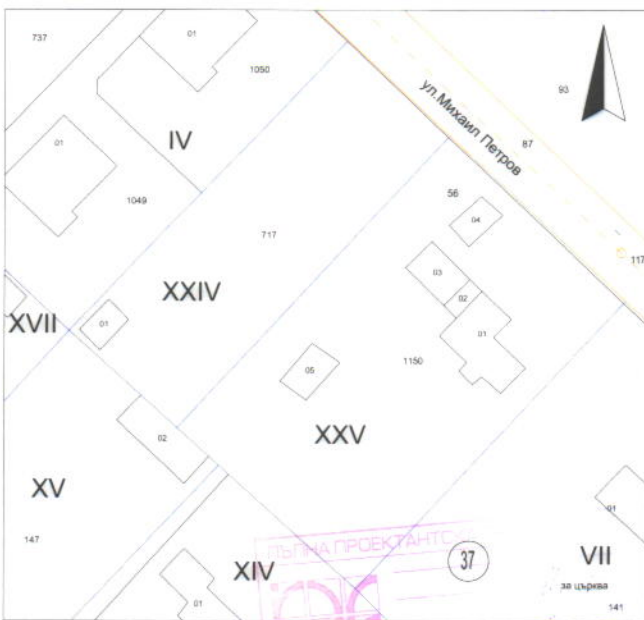
РЕГУЛАЦИЯ, М 1:1000