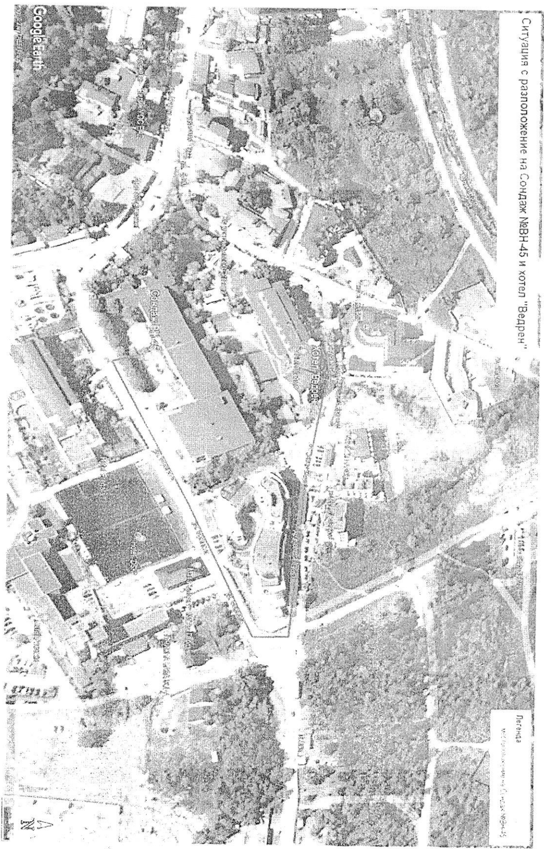
Фиг.№1. Местоположение на Сондаж Вн-45 "АЕЛ Козлодуй" и котел "Вардар" в Кранено. Сателитна снимка близък план

Обясновка на необходимите водни обеми за подхранване от Сондаж Вн - 45 АЕЛ „Козлодуй“ - разкрити минерални води, изключителна държавна собственост - Находките № 100 от списъка към Приложение - 2 към Чл. 14, т.2 от Закона за водите