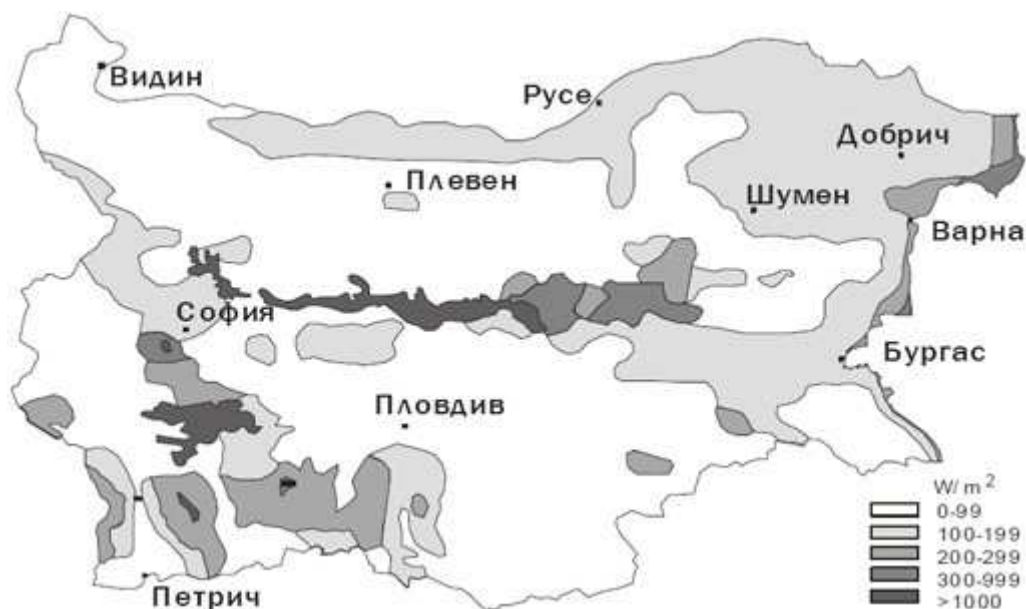
Карта на теоретичния ветрови потенциал

Тези зони са с обща площ около 1 430 km 2 , където средногодишната скорост на вятъра е около и над 6 m/s. Тази стойност е границата за икономическа целесъобразност на проектите за вятърна енергия. Следователно енергийният потенциал на вятъра в България не е голям. Бъдещото развитие в подходящи планински зони и такива при по-ниски скорости на вятъра зависи от прилагането на нови технически решения.